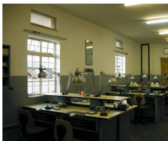
Il laboratorio con le nuove attrezzature