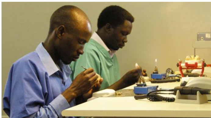
Alcune foto degli studenti al lavoro

Con la ripresa dell'anno accademico sono 23 gli studenti che frequentano settimanalmente il laboratorio: 12 gli odontotecnici e 11 gli studenti al 5° anno di odontoiatria ”