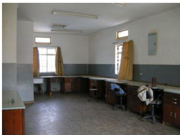
Il laboratorio prima degli interventi