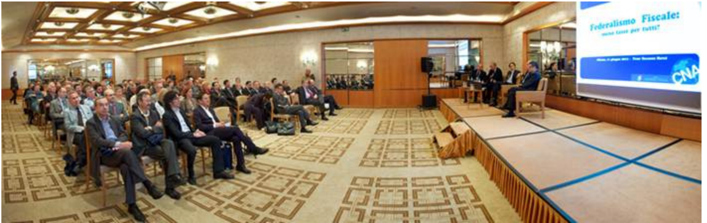
Un momento della tavola rotonda sul federalismo fiscale che si è svolta nell'ambito dell'Assemblea annuale CNA Lombardia.